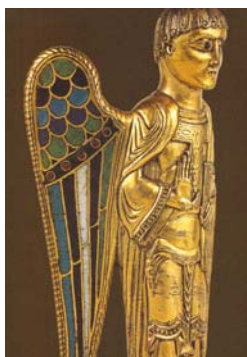
Le reliquaire "ange"