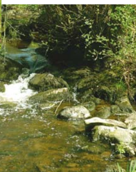
Rivière au moulin de Peupiton