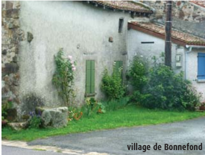
village de Bonnefond