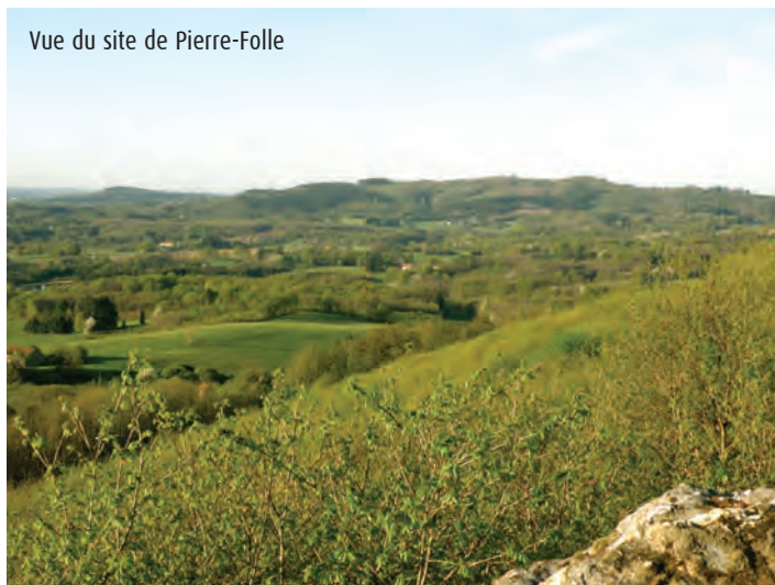
Vue du site de Pierre-Folle

8 200 m après un panneau indiquant le village de la Renaudie, emprunter à droite à nouveau le chemin empierré pour revenir au point de départ.